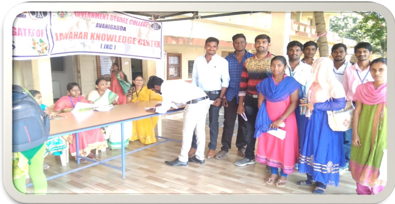
Registration Desk for Job Fair