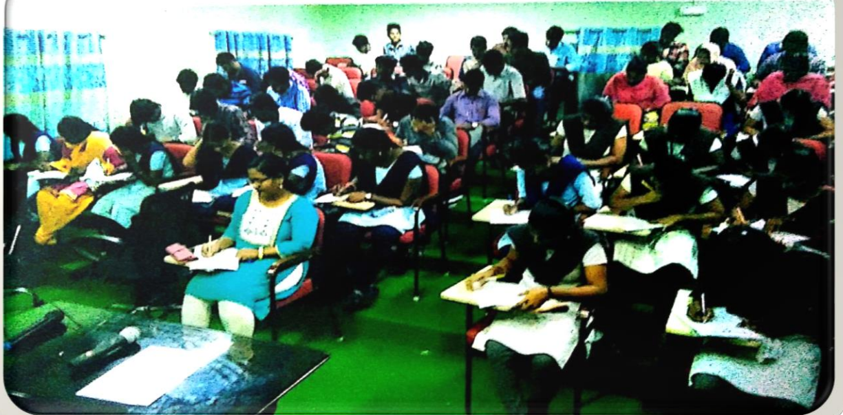
Conducted Written Exam For Political Radies