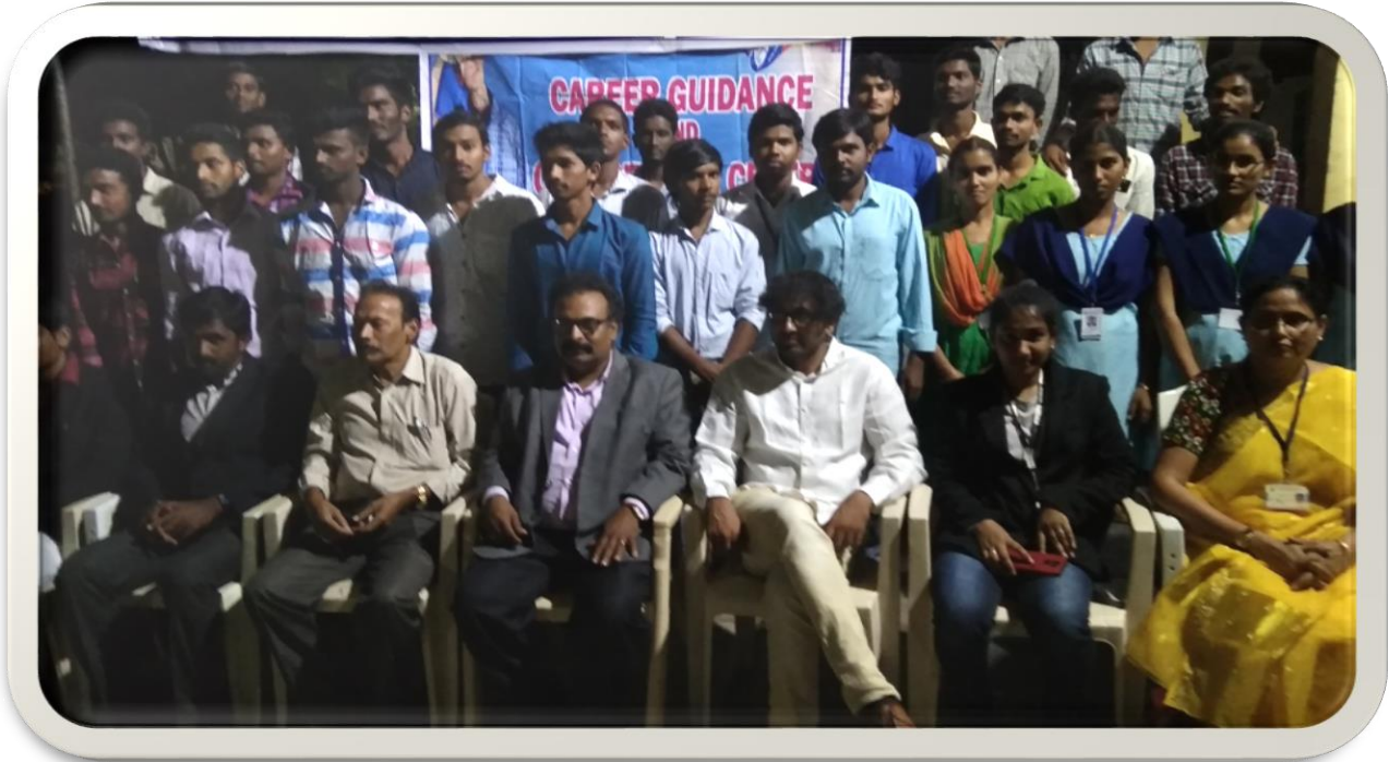
Selected Students with Principal , JKC Coordinator, JKC Mentors HRs

Raj Group Techno Solutions Pvt Ltd Company Participated on 15-02-2019.